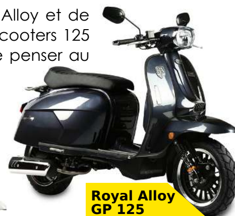
Royal Alloy GP 125