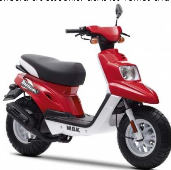
Booster version d'après 2004

Concernant le Booster "de base", ou le "vrai" si on peut dire, on notera principalement une légère refonte qui a eu lieu en 2004 en modifiant notamment la partie inférieure de la face avant plus "recouvrante". Ce design sera conservé ensuite jusqu'au bout.