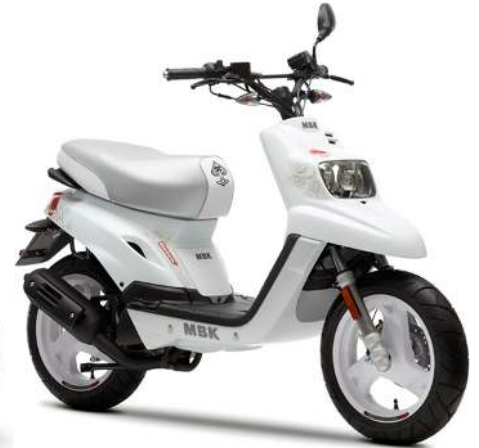
Booster Naked 13"