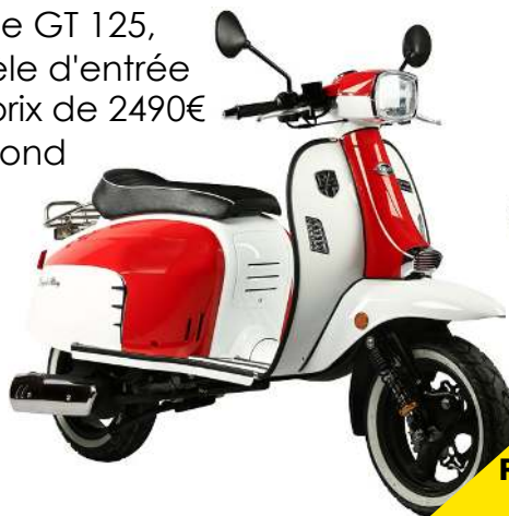
Royal Alloy GT 125

On note également cette année l'arrivée de la marque Royal Alloy et de ses 2 scooters 125cc. La spécialité de la marque anglaise : les scooters 125 néo-rétro. En voyant ces deux-roues on ne peut s'empêcher de penser au célèbre Vespa. Le premier scooter, le GT 125, a un look plus vintage, c'est le modèle d'entrée de gamme de la marque avec un prix de 2490€ (disponible depuis Mai 2018). Le second est un modèle un peu plus haut de gamme, le GP (Grand prix) 125, avec un look total black et une coque spécifique. Ce dernier est présenté à 3490€ (disponible depuis Juin 2018).