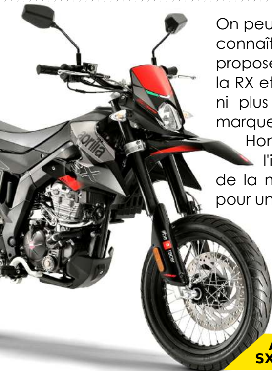
APRILIA SX Euro 4

On peut déjà dire que 2018 sera l'année du 125cc. En effet le segment connaît une croissance de la demande qui pousse les constructeurs à proposer des nouveautés. Aprilia nous présente 2 nouveaux modèles, la RX et SX (ci-contre) Euro 4, motorisés en 4-temps. Ces dernières sont ni plus ni moins que des Derbi rebaptisées. Derbi étant une des marques du groupe Piaggio, tout comme Aprilia.