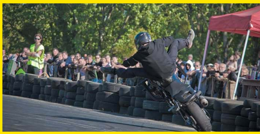
Affiche du SBI CONTEST 2018

Si vous souhaitez avoir plus d'informations sur cet événement, rendez-vous sur la page facebook "Dream Piste - Shows et Actus" ou sur celle du sponsor "50Factory.com". Ne ratez pas ce contest de stunt qui devient incontournable.