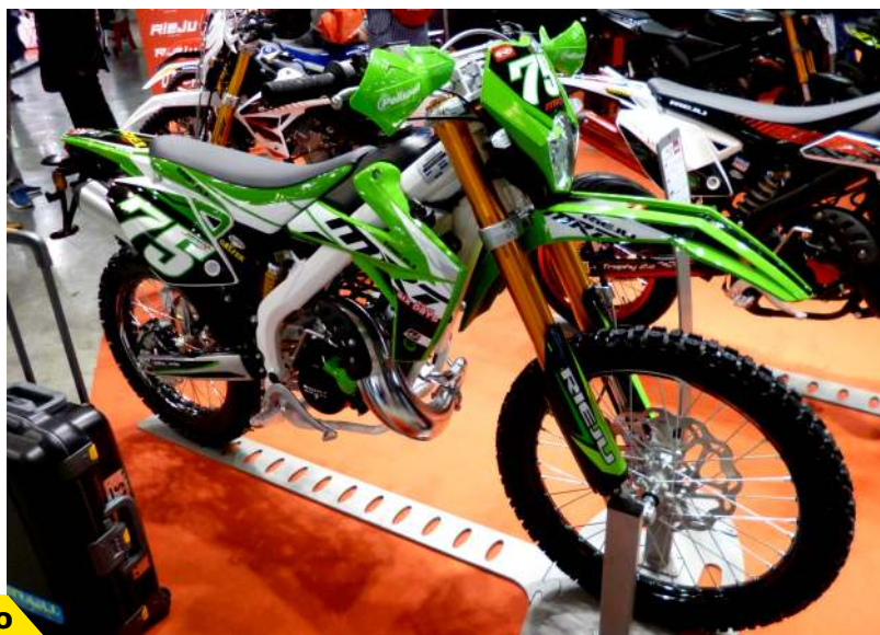
Rieju MRT Pro

Pour ce qui est du 50 à boîte, on retrouve en première place Rieju et ses 814 immatriculations pour Décembre (les 3/4 en Euro 2 et le reste en Euro 4). Vient ensuite Derbi qui réalise le même score qu'en Décembre 2016, puis Masai (480 immat.) et Magpower (293 immat.) qui passent tout les deux devant Beta. Ce dernier avait arrêté de livrer en Euro 2 depuis le mois d'Octobre.