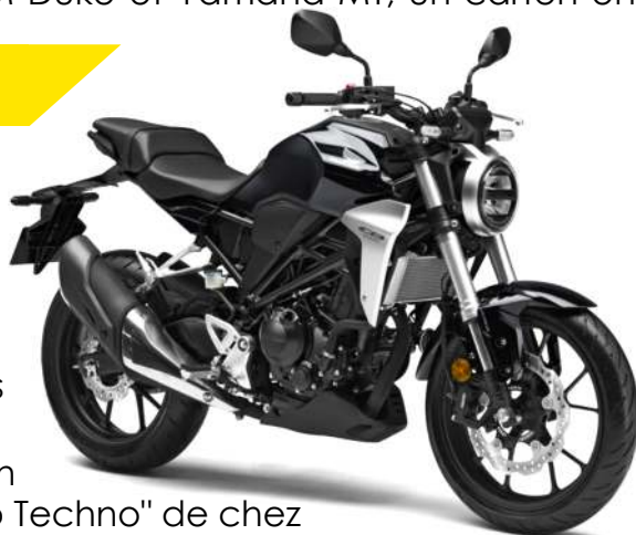
HONDA CB 125-R

On voit également la forte tendance des 2 roues vintages chez ces nouvelles 125cc, avec par exemple le scrambler de la marque Orcal, le NK-01, très proche visuellement d'un scrambler de chez Masai. Ou encore la sortie du "Néorétro Techno" de chez Fantic, le Caballero, bel exemple de ce style mêlant vintage et futurisme. Tout comme la Century de Rieju qui est une des belles nouveautés de cette année 2018.