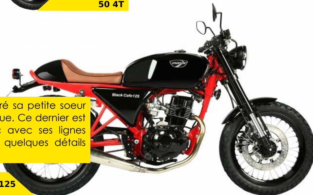
La Black Café 125

La Black Café 125 qui a inspiré sa petite soeur en 50cc est le modèle identique. Ce dernier est très fidèle au modèle 125cc avec ses lignes vintages. Seuls le moteur et quelques détails changent.