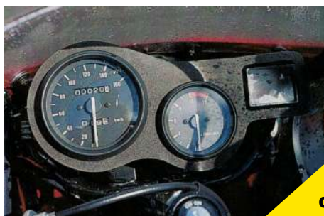
Tableau de bord de la TZR 50 Checa