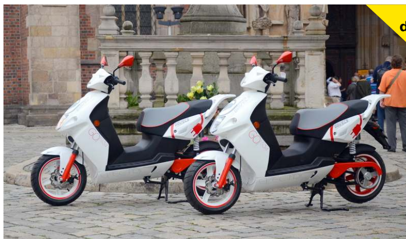
Scooters de la marque GOVECS

Mais cela vient aussi des nombreuses aides à l'achat d'électriques ainsi que de la promotion faites sur ce type de véhicule. Sans oublier les nombreux parcs de scooters électriques mis à disposition à la location (Exemple : Cityscoot à Paris).