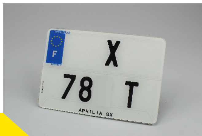
Plaque pour 50cm 3

Ces nouvelles dimensions s'appliquent aussi bien aux cyclomoteurs et scooters (50cm 3 ) qu'aux motos. Les 50cm 3 passent ainsi d'un format de 140x120 millimètres à celui de 210x130 millimètres (ou 210x145mm avec la raison sociale).