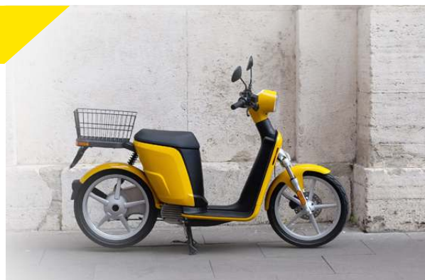
Scooter de la marque Askoll

Mais cela vient aussi des nombreuses aides à l'achat d'électriques ainsi que de la promotion faites sur ce type de véhicule. Sans oublier les nombreux parcs de scooters électriques mis à disposition à la location (Exemple : Cityscoot à Paris).