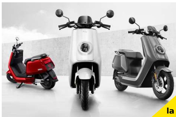
Scooters de la marque NIU

Le marché de l'électrique a mit du temps à se lancer, mais c'est avec une hausse de 62% que débute l'année 2017 sur les ventes d'équivalents 50cm 3 électriques en Europe. La France quant à elle connaît une augmentation de 9%. Une réussite pour ce segment prometteur. En comparaison, les immatriculations de motos électriques (plus de 50cm 3 ) sont en hausse de 35,5% sur l'Europe. Cet engouement pour l'électrique s'explique par une volonté globale de développement. L'offre s'élargit avec l'arrivée par exemple de scooters Askoll ou encore du Niu N1S Civic, sans oublier le fort développement des deux-roues de la marque Govecs.