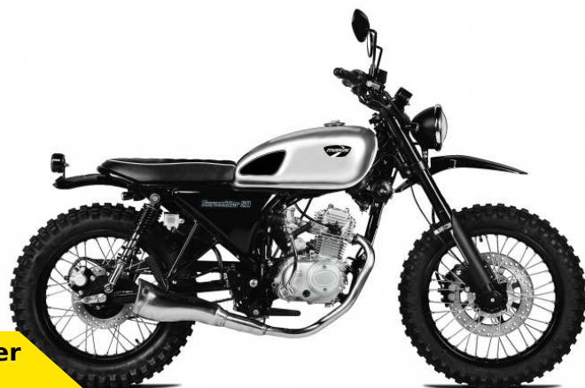
La Scrambler 50 4 T

Inspirée des motos anglaises des années 50, la Scrambler nous fait remonter le temps pour seulement 1990€. Une tenue Steve Mac Queen avec ce coloris argent pour ce modèle 4 temps à boîte 5 rapports. Une petite moto pour rider tranquillement aussi bien sur route que chemin avec une sonorité digne de son look so british !