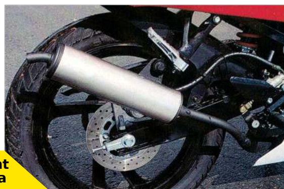
Pot d'échappement de la TZR 50 Checa

La Yamaha TZR 50 était déclinée sous la marque MBK avec le XPower. Cela aussi bien pour l'ancienne que la dernière génération.