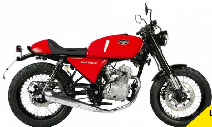
La Black Café 50 4T

Ce modèle reprend la même base que son inspiration en 125cc avec un look plus racing que celui de la Scrambler accentué par sa selle monoplace. Ce modèle est également un 4 temps à boîte 5 rapports. Petit détail, elle est disponible uniquement en rouge et pour le même prix que celui de la Scrambler (1990€). Un style incomparable pour une machine accessible dès 14 ans ! On adore.