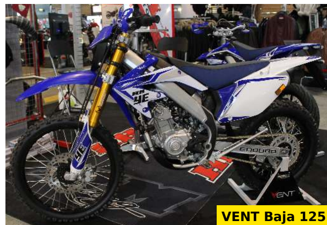
VENT Baja 125

Présentes sur notre stand au Salon du 2 Roues de Lyon, les deux-roues de la marque Vent, distribuées par HM France, font partie des plus belles 50 à boîte vues à l'événement. Nous avons trois 50cc et une 125cc, toutes dans leur style impeccable. Nous sommes ici sur des motos plutôt haut de gamme pour un budget de 3600€ environ. Il faut reconnaître qu'elles sont belles !