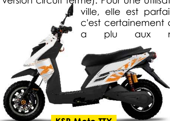
KSR Moto TTX

acheteurs de la SOCO TS. En effet la marque commence à se faire un nom parmi les constructeurs en entrant, en 2018, dans le classement des vendeurs de cyclos aux côtés de Beta, Rieju, Derbi, ou encore Piaggio et Peugeot (entre autres). Bravo au petit nouveau !