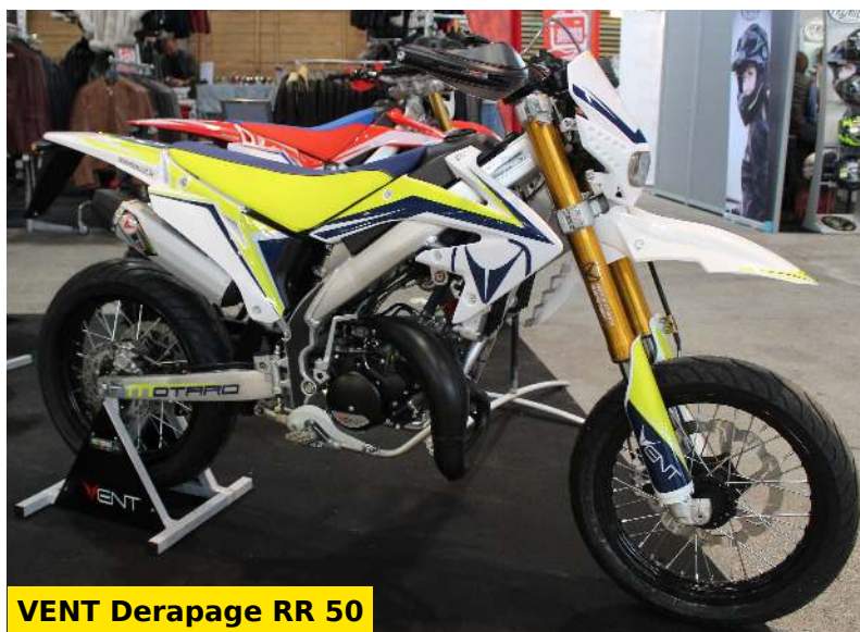
VENT Derapage RR 50

Présentes sur notre stand au Salon du 2 Roues de Lyon, les deux-roues de la marque Vent, distribuées par HM France, font partie des plus belles 50 à boîte vues à l'événement. Nous avons trois 50cc et une 125cc, toutes dans leur style impeccable. Nous sommes ici sur des motos plutôt haut de gamme pour un budget de 3600€ environ. Il faut reconnaître qu'elles sont belles !