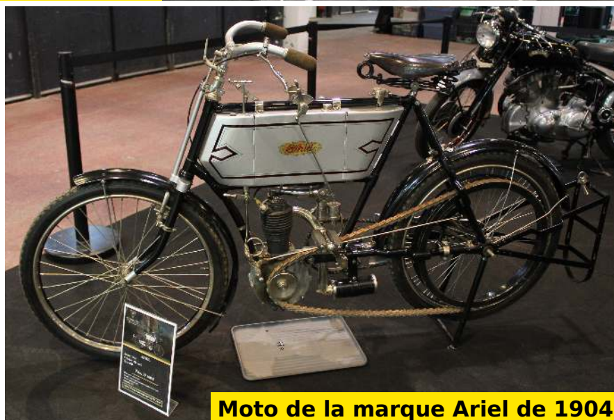
Moto de la marque Ariel de 1904

Belle découverte : les motos de trial électriques de la marque Electric Motion. Bravo les français !