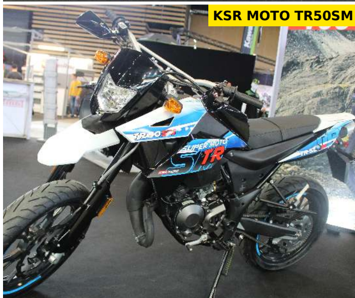
KSR MOTO TR50SM