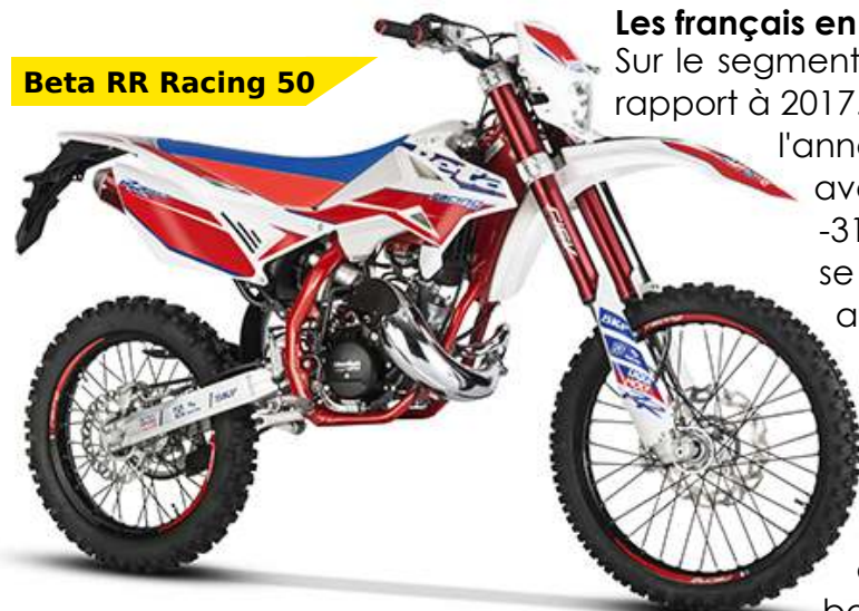
Beta RR Racing 50