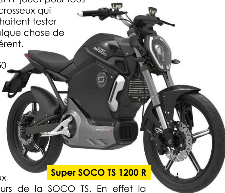
Super SOCO TS 1200 R

Dans un style plus routier on vous présente la 50 électrique de la marque australienne Super SOCO, la TS 1200 R. A la différence du Kalk OU, celle-ci est disponible en plusieurs coloris. Concernant son autonomie, cela tourne autour des 50 - 80km, pour une vitesse maximale de 45km/h (70km/h en version circuit fermé). Pour une utilisation en ville, elle est parfaite ! Et c'est certainement cela qui a plu aux nombreux