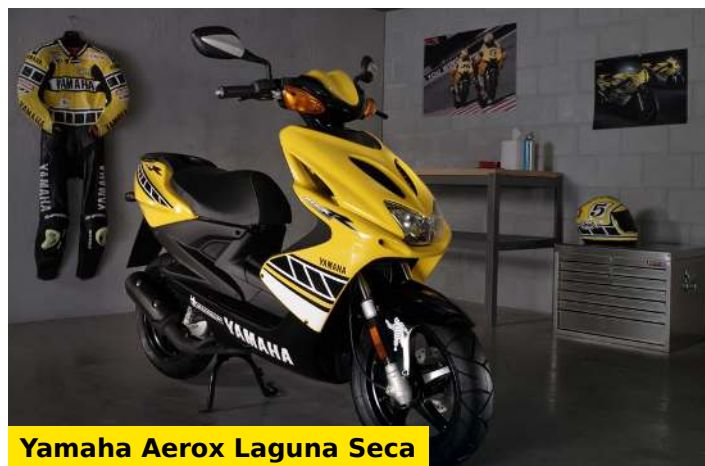
Yamaha Aerox Laguna Seca