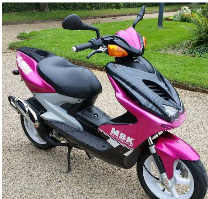
MBK Nitro série spéciale F1 Assistance 1998

Années de production : de 1997 à 2002 (puis nouvelle version depuis 2013) Moteur : Minarelli horizontal liquide Fourche : Paioli Hydraulique 30mm Démarrage : Démarreur électrique + kick Carburateur : Dellorto PHBN 12 Cadre : Acier Pneus : Avant 130/60-13 Arrière 140/60-13