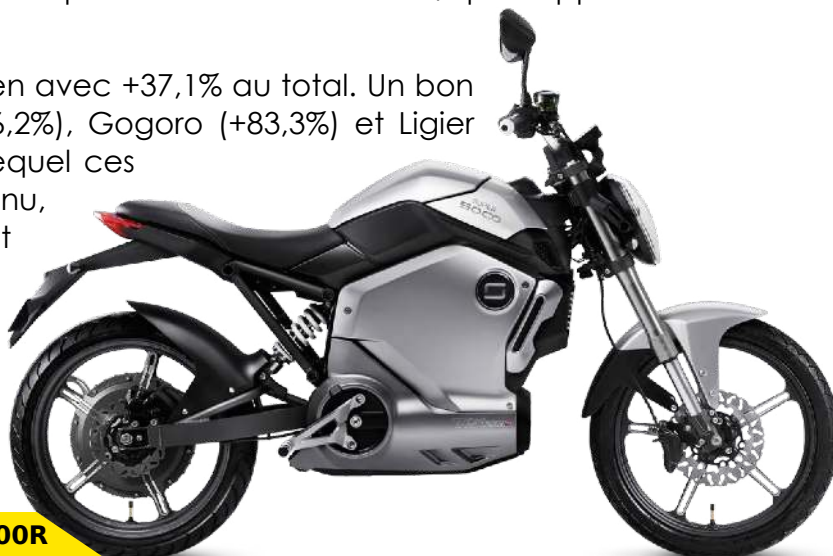
Super Soco TS 1200R

Enfin, l'électrique se porte toujours aussi bien avec +37,1% au total. Un bon résultat réalisé en partie par Govecs (+96,2%), Gogoro (+83,3%) et Ligier (-32,8%) dû au commerce en B to B sur lequel ces marques sont positionnées. Mais Niu et Unu, vendant au grand public, sont également en hausse sur l'année avec respectivement +219,5% et 227,7%. A noter la présence du nouveau : Soco, avec ses motos électriques (500 immatriculations sur 2018).