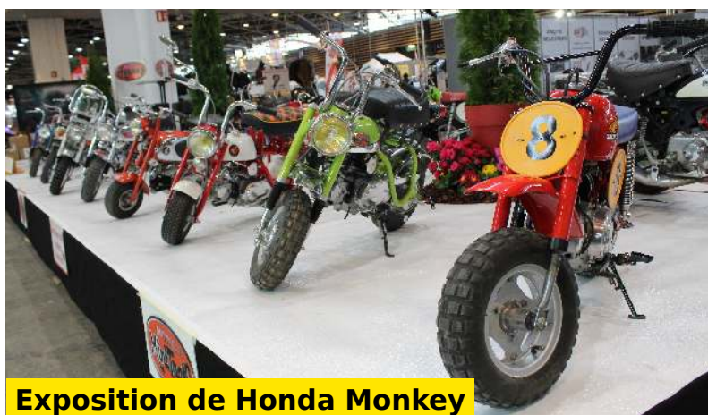
Exposition de Honda Monkey