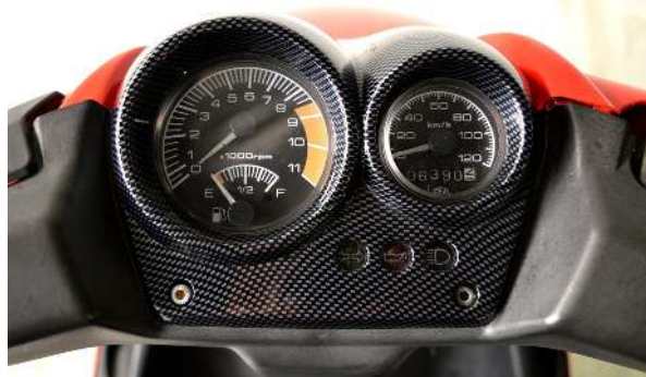
Tableau de bord du MBK Nitro qui propose un compte-tours, un élément rare sur un scooter 50cc.