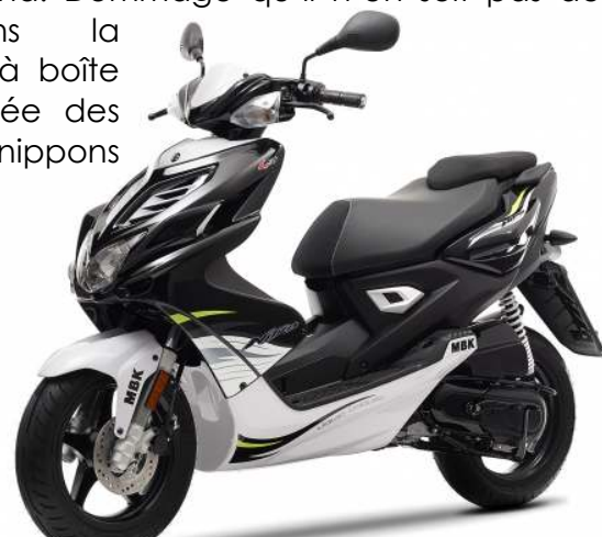
MBK Nitro 2ème Génération à partir de 2013