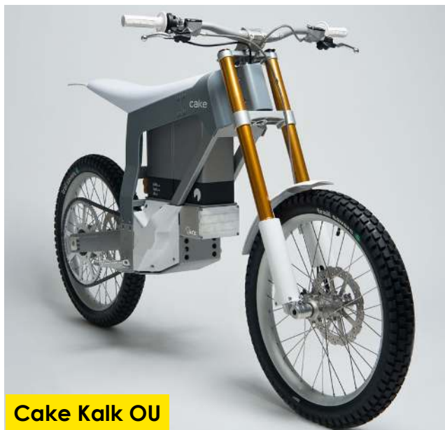
Cake Kalk OU

Ca bouge du côté de l'électrique ! Le constructeur Cake, ça vous parle ? On a découvert cela avec plaisir. On est ici dans le haut de gamme de la moto électrique puisque le modèle Kalk OU, qui a commencé à être livré en Janvier 2019, est proposé au prix public de 13 000€. Le prix à payer pour pouvoir faire du tout-terrain à zéro émission de CO2 grâce à ce deux-roues. Sa vitesse maximum est de 75km/h et son autonomie est de 80km. Cette moto est spécialement conçue pour le tout-terrain, le trial... C'est LE jouet pour tous les crosseux qui souhaitent tester quelque chose de différent.