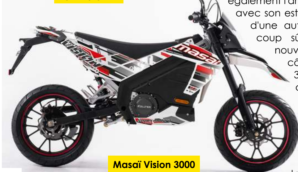
Masai Vision 3000

Dans les nouveautés électriques on compte également l'arrivée du scooter TTX, de chez KSR, avec son esthétique soignée. Un bon produit, d'une autonomie de 73km, qui plaira à coup sûr aux plus jeunes. Mais une nouveauté est surtout à souligner du côté de Masai avec son Vision 3000, un supermotard électrique d'un équivalent 50cc. L'autonomie de cette moto est de 60km pour une vitesse max de 45km/h. Disponible depuis Mars 2019 le Vision 3000 est annoncé au prix de 3490€. Pas mal placé pour ce type de technologie !