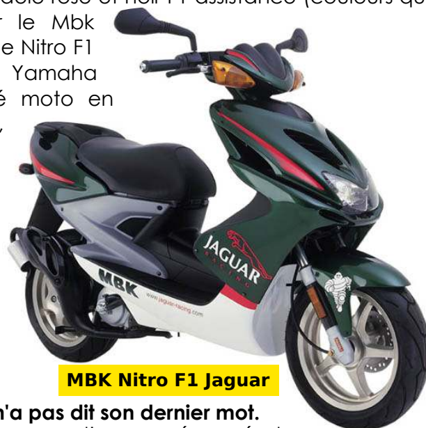
MBK Nitro F1 Jaguar