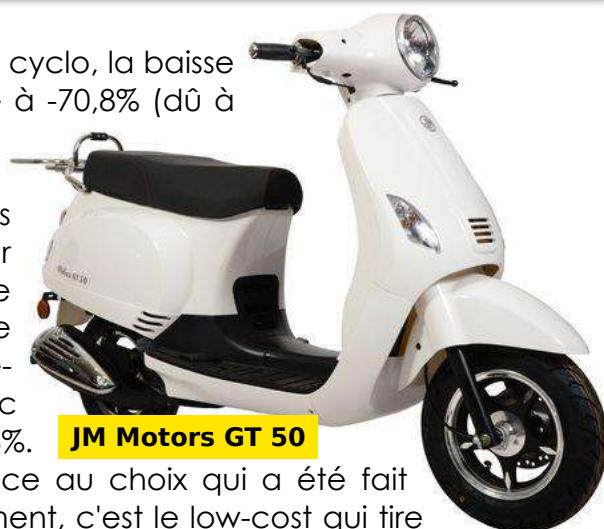
JM Motors GT 50

Cette dernière passe de la 5ème à la 3ème place grâce au choix qui a été fait d'abandonner rapidement le 2T au profit du 4T. Globalement, c'est le low-cost qui tire son épingle du jeu au cumul annuel 2018. Mention spéciale à JM Motors, et ses scooters 4T, qui réalise une hausse de 27,8% passant de la 13ème à la 5ème place du classement. Bravo !